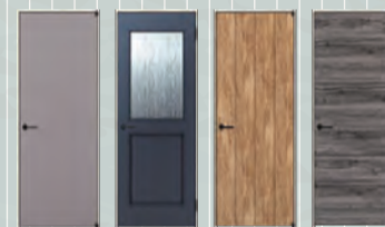
住空間にアクセントをプラスする トレンドシリーズ「ラフォレストF」