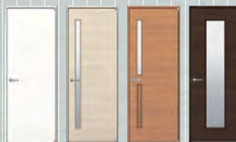
さまざまなテイストの空間と調和する スタンダードシリーズ「ラフォレスト」